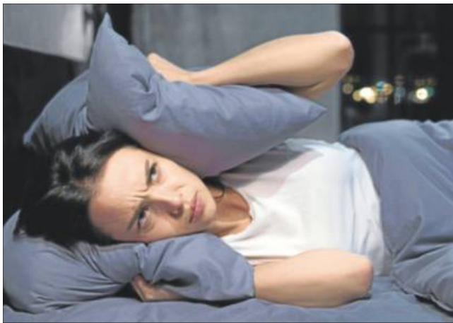
Nabostøj forstyrrer mere end 35 pct. af de folk, der bor i lejlighed i Danmark.