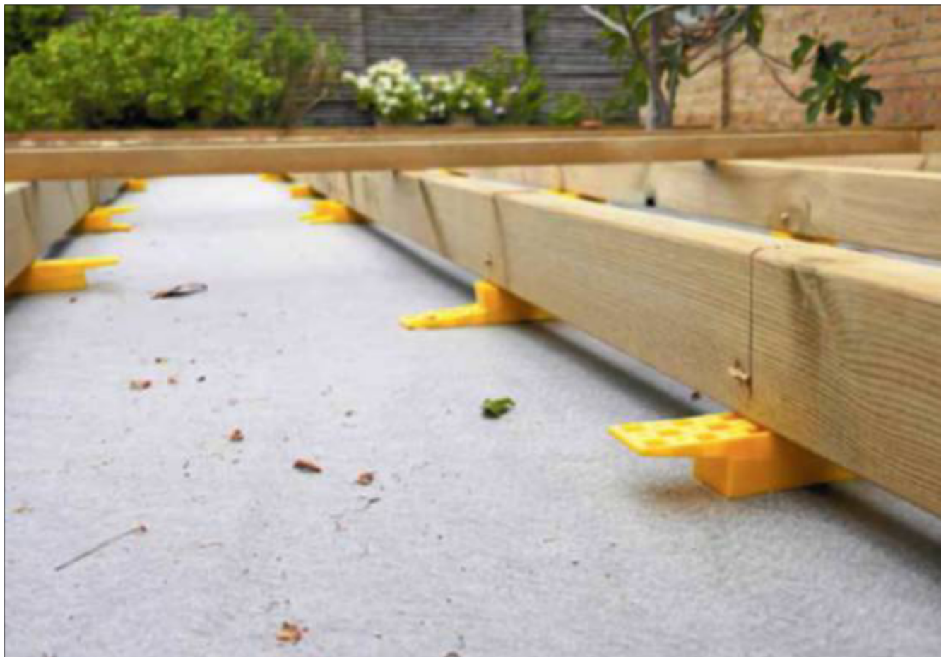
Den kule kile blev opfundet for 50 år siden af en tømrermester og hans svigersøn for at klodse gulve op.