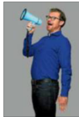
Sebastian Dorset optræder i Gjethuset den 12. marts.

Gennem snart 25 år som stand-up komiker, har Sebastian Dorset ledt efter de helt rigtige ord og opdaget at dem finder man kun, hvis man ikke er bange for at sige noget forkert. Kan man stadig risikere det i 2020? Er der plads til at navigere mellem de hyperforsigtige, der hører fornærmelser og i hver eneste vittig bemærkning, og så de kronisk rasende, der kun kender skældsord, og bruger dem til samme