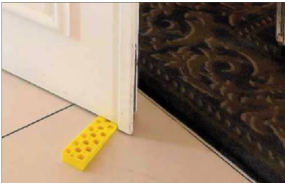
De fleste kender nok i kilen - ganske mange tror fejlagtigt, at det er en dørstopper.

Villa på Cellovej 9, Liseleje, solgt for 1.715.000 kr. d. 06-01-2020